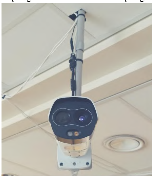
BEKONTAKTĖ TERMORIZINĖ KAMERA

Tuo tikslu įrengtos/atnaujintos izoliavimo patalpos su atskirais įėjimais iš lauko, esamos patalpos ir laukiamųjų zonos maksimaliai pritaikytos saugiai dirbti su įvairių grupių pacientais, suskirstyti ir suvaldyti pacientų ir darbuotojų srautai, prie įėjimų į polikliniką įrengti „pacientų filtrai“, prie pagrindinių įėjimų įrengti termovizorius bei temperatūros matuokliai. Prie įėjimų ir įstaigos patalpose įrengti dezinfekciniai stovai. Įrengta nauja infekuotų atliekų patalpa.