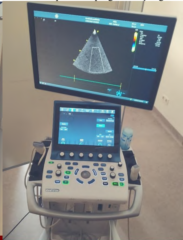
KONSULTACIJŲ SKYRIAUS ULTRAGARSINĖ DIAGNOSTINĖ ĮRANGA KARDIOLOGINIAMS TYRIMAMS

2020 m. parengtos trys naujos tvarkos siekiant gerinti skaidrumo bei atskaitomybės veikloms: