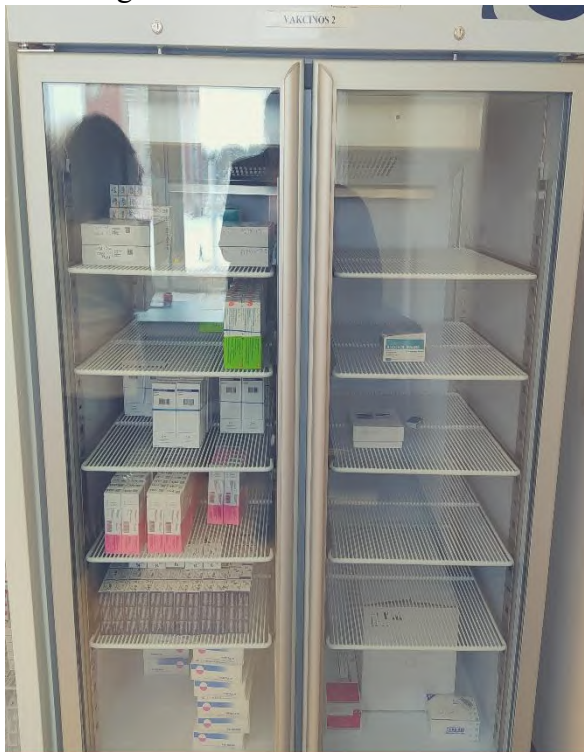
KLINIKINĖS DIAGNOSTIKOS LABORATORIJOS ŠALDYTUVAS VAKCINŲ LAIKYMUI

Registratūra: bekontaktės termovizinės kameros komplektu su programine įranga.