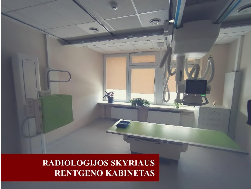
RADIOLOGIJOS SKYRIAUS RENTGENO KABINETAS