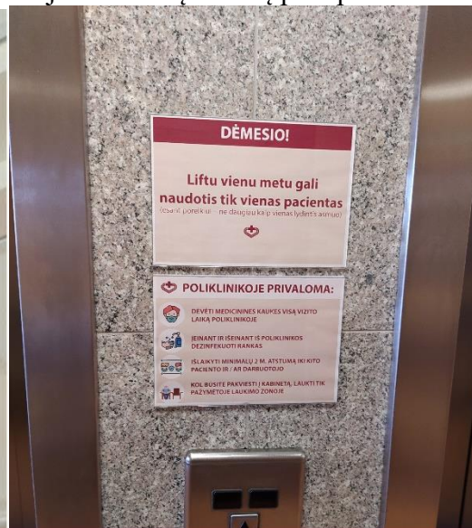
SKELBIAMOS AKTUALIOS INFORMACIJOS PACIENTAMS PAVYZDYS