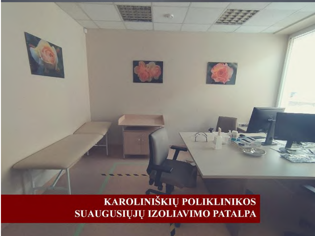
KAROLINIŠKIŲ POLIKLINIKOS SUAUGUSIŲJŲ IZOLIAVIMO PATALPA